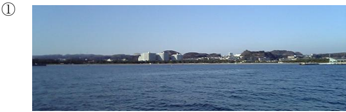
① 泊地に最適。底質は砂の上に泥がのっている感じ。

◎アンカリング 陸地に囲まれているため、アンカリングに最適です。天候に注意すればオーバーナイトも可能ではないでしょうか。 大きな波は立ちませんが、東よりの風が吹くと若干波立ちます。 ウェイクボードを楽しむ人や、釣船の航行が多いので、日中は曳き波が多くチャブチャブしています。 このあたりの浅場にはアサリが自生しているので時期になると、潮干狩りが楽しめます。