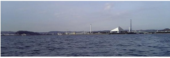
④ 沖から入港してくる際は、八景島の水族館（三角屋根）が目印です。