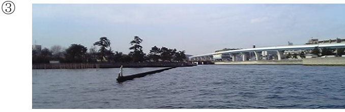
③ 平潟湾へ入る際には導水堤に注意！満潮時は水没するので非常に危険。