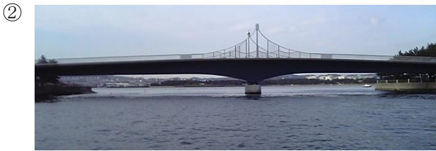
② この橋の下の八景島側に浅い部分があるので注意！